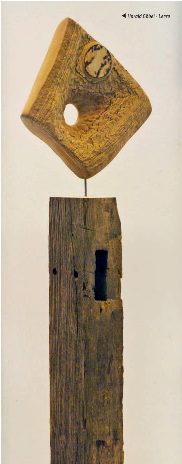
◀ Harald Göbel - Leere